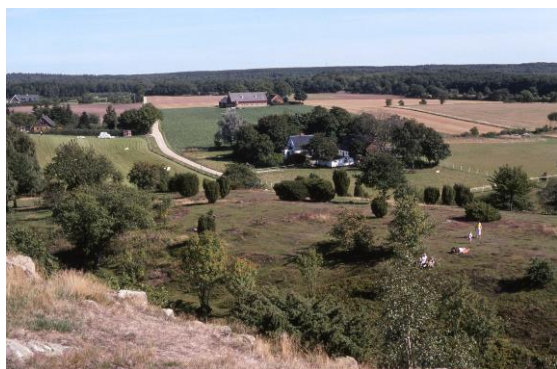
Utsikt från föreningens eget berg, Billebjär

På hemvägen kan du fortsätta ned på Billebjärs södra sida och cykla via Sjöstorp ner till cykelstråket längs vägen mellan Dalby och Lund.