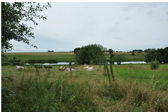
Kävlingeån vid Rinnebäcksvad

Vid stridens början låg de båda arméerna på var sin sida om Kävlingeån norr om Lund. Eftersom den svenska armén var i dåligt skick beslöt man att satsa allt på ett anfall.