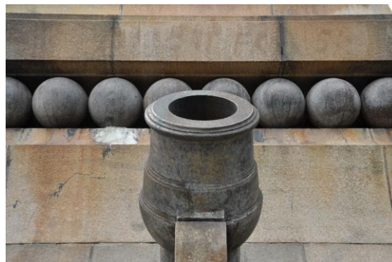
Detalj av Monumentet

Natten till den 4 december gick svenskarna över den frusna ån vid Rinnebäcksvad och fortsatte mot Stångby. De båda arméernas huvudstyrkor möttes nära nuvarande Monumentet norr om Lund. Större delen av den danska armén flydde tillbaka norrut mot Landskrona, men återstoden drabbade samman med svenskarna på flera ställen mellan Kävlingeån och Lund. På eftermiddagen var svenskarna hårt trängda men Karl XI och ett tusental ryttare, som förföljt den danska huvudstyrkan, kom då tillbaka och lyckades omringa de danska trupperna. På grund av segern kunde svenskarna stanna kvar i Skåne, och gränserna förblev oförändrade. Mer info: visitlund.se/gora/topp-tio-omgivningarna/