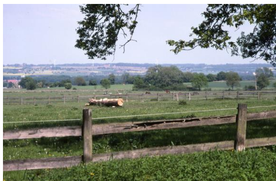
Landskapet norr om Linnebjär

På tillbakavägen cyklar du ner till Södra Sandby. I korsningen mitt i byn börjar Hardebergaspåret som går till Lund.