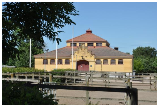
Vackert stall i Flyinge Kungsgård

på cykelbanan mot Flyinge samhälle och sedan söderut till Flyinge kungsgård. Från kungsgården till Södra Sandby måste du följa en vanlig väg, men från Sandby kör du på Hardebergaspåret.