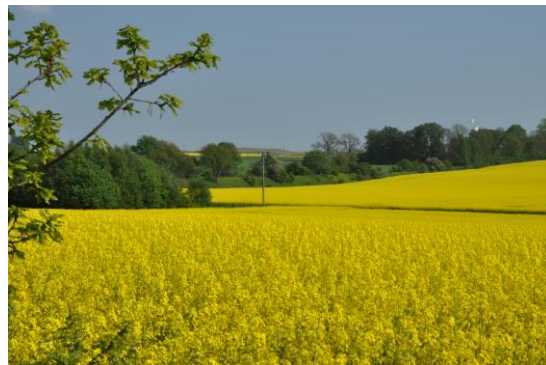
Blommande rapsfält längs Hardebergaspåret

Vägbeskrivning: Från Stortorget cyklar du förbi Botaniska trädgården och vidare genom S:t Jörgens park. Då hamnar du på cykelspåret, som fortsätter hela vägen till Södra Sandby.