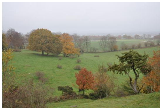
Utsikt från Måryd på hösten

Från Måryd fortsätter du på vägen till Torna Hällestad, där du tar t.h. på en banvall som leder till Dalby. Genom Dalby finns en cykelbana, och från Dalby är det cykelbana längs den stora vägen till Lund.