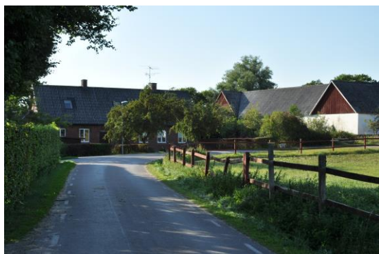
Sjöstorps by på vägen mot Dalby

Vägbeskrivning: Cykla på lila cykelled via Hardebergaspåret (en gammal banvall) till Södra Sandby. Där tar du t.h. uppför Almbacksvägen. Alternativt kan du efter Fågelsångsdalen ta t.h. på smågator och cykelvägar förbi Uggleskolan. Efter ett par km kör du under landsvägen och kommer fram till Skrylle.