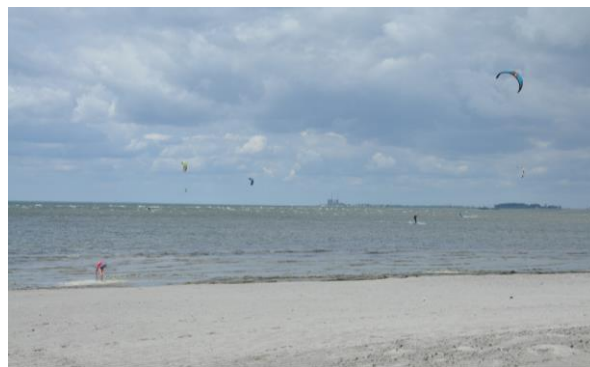
Stranden mellan Lomma och Habo Ljung

Vägbeskrivning: Man kan cykla via Trollebergsvägen och längs den stora vägen mot Lomma (vilket blir 11 km). Alternativet går via Hjärup och är bara 1 km längre. Hem kan du fortsätta norrut längs stranden och genom Habo Ljung och ta till höger efter byn (österut). Cykla via Önnerupsvägen samt Fjellie så finns där en vägtunnel under den stora vägen.