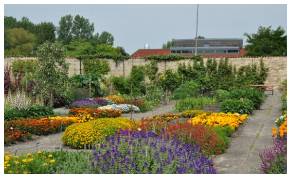
Sortimentträdgården i Alnarpsparken

samhället. På hemvägen kan du cykla genom Alnarp och sedan på en cykelbana längs järnvägen mot Lomma. Därifrån kan du cykla via Hjärup hem eller längs den stora vägen.