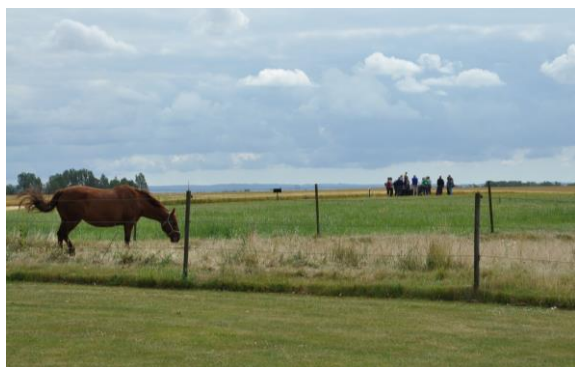
Utgrävningar vid Uppåkra kyrka

Vägbeskrivning: Följ först cykelskyltarna söderut mot Malmö. Efter 5 km tar du till vänster (österut) mot Uppåkra kyrka där utgrävningarna är. Fortsätt söderut en och en halv km och tag till vänster mot Tirup. Från Uppåkra kyrka är det landsväg med ganska lite trafik och den sista biten är en fin och smal liten väg. Cykla hem samma väg eller via Gullåkra.