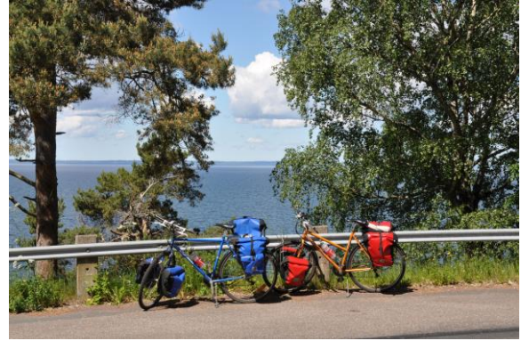
Kort rast vid Vättern

slöcykling. Ibland vill vi helt enkelt cykla långt till ett fjärran mål. Andra gånger vill vi bara glida fram mellan mat- och fikaställen.