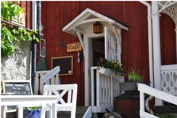
Ett trevligt café dyker upp när det som bäst behövs.