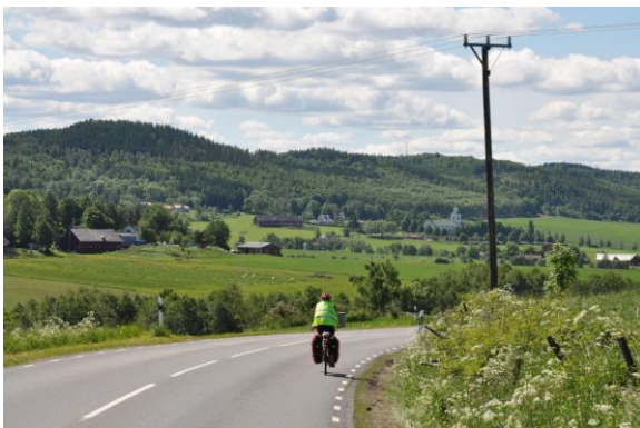
Nedförsbacke, ingen trafik, goda utsikter. Skärstad k.a.

Med god planering kan vi ordna det mesta av detta. Då blir cyklingen en härlig, bekymmerslös resa genom landskapet. Vi kan stanna precis var vi vill och vi mår fantastiskt bra.