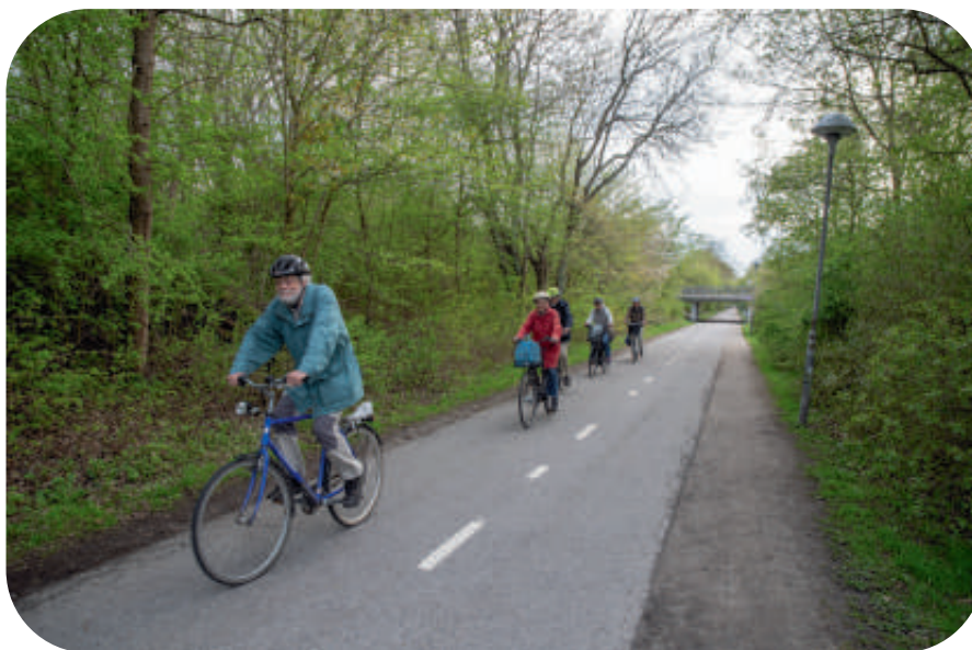
Cykelgruppen 2020 på Hardebergaspåret.

Oljekrisen medförde att den snabba ekonomiska utvecklingen bromsades upp. 1975 invigdes Barsebäcks två reaktorer och med olyckan i Harrisburg USA år 1979 blev vidare utbyggnad av kärnkraften en känslig miljöfråga. 1978 avgick stadsminister Fälldin på grund av kärnkraftsfrågan och centern motionerade om folkomröstning som genomfördes 1980. Miljörelsen kraftsamlade mot kärnkraft medan Naturskyddsföreningen var avvaktande då flera företrädare såg den som en räddning för bland annat de norrländska älvarnas bevarande från fortsatt vattenkraftsutbyggnad. När resultatet av folkomröstningen inte blev tydligt gick en hel del kraft ur miljörelsen. Andra viktiga frågor under denna tid var bokskogens omvandling till granplanteringar som ledde fram till bokskogslagen 1974 och ädellövskogslagen 1984. Den snabba byggnationen i regionen hade tagit hårt på grusförekomster och täktverksamheten kritiserades och reglerades allt mer.