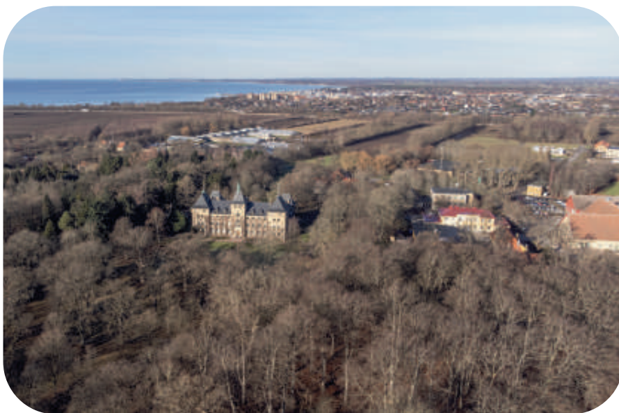
Alnarpsparken. Foto: Per Blomberg. (Spridningstillstånd LM2023/038789)