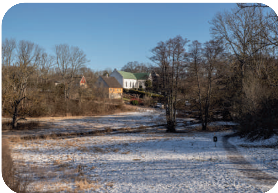
Rååns dalgång.

Vi åker med tåg från Lund till Gantofta kl 9.58 (med byte i Ramlösa), och tillbaka från Ramlösa till Lund kl 15.56. Kontaktperson: Gertrud Berger 0730-980148.