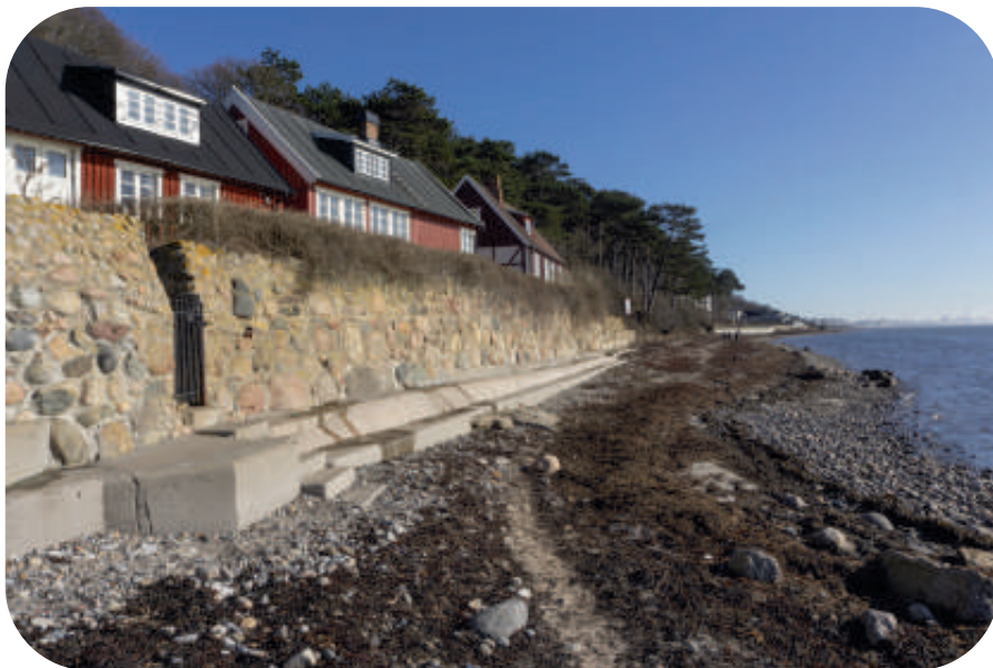
En erosionspåverkad strand norr om Helsingborg.