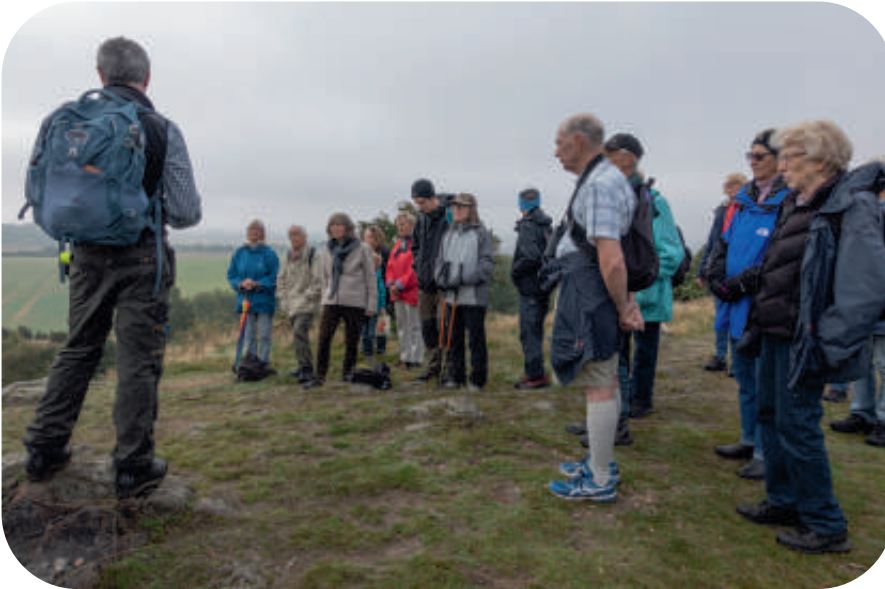
Exkursion till Billebjär 2015.