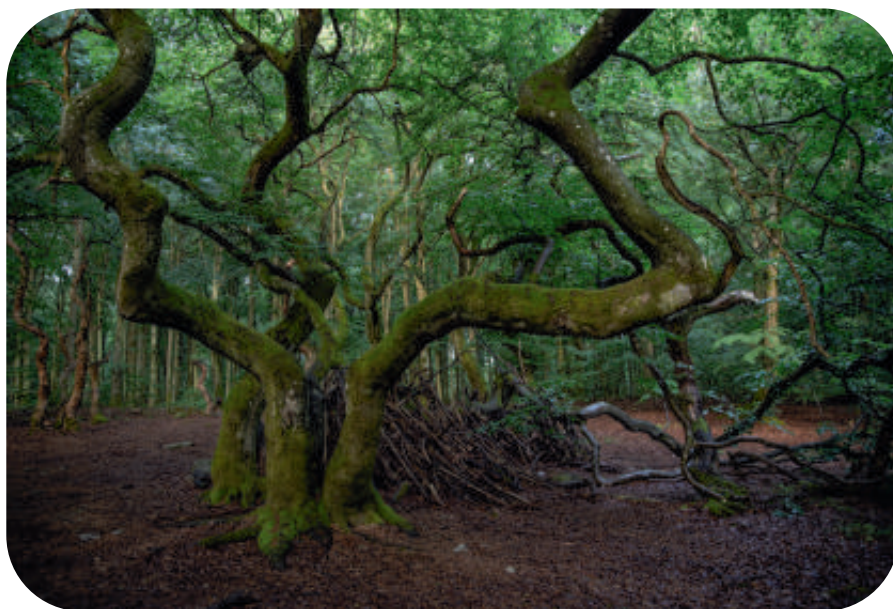
Vresbokar vid Torna Hällestad.

månadens slut. Och rör inte vårt kött och våra arbetstillfällen! Vilka förluster i klimatomställningens följd är orättvisa, och vad bör göras för att främja en rättvis omställning? Dessa frågor analyseras utifrån både empirisk forskning och filosofisk reflektion av Eric Brandstedt, lektor i mänskliga rättigheter och docent i praktisk filosofi vid Lunds universitet.