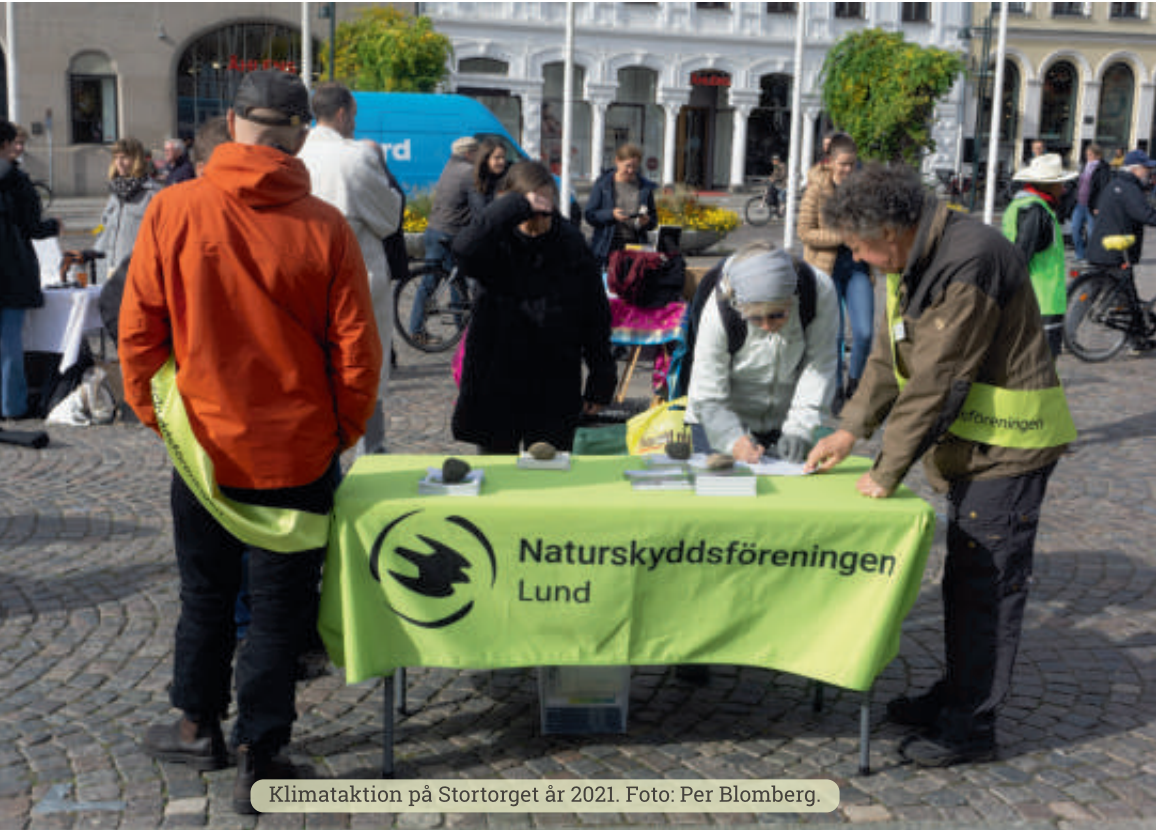
Klimataktion på Stortorget år 2021.