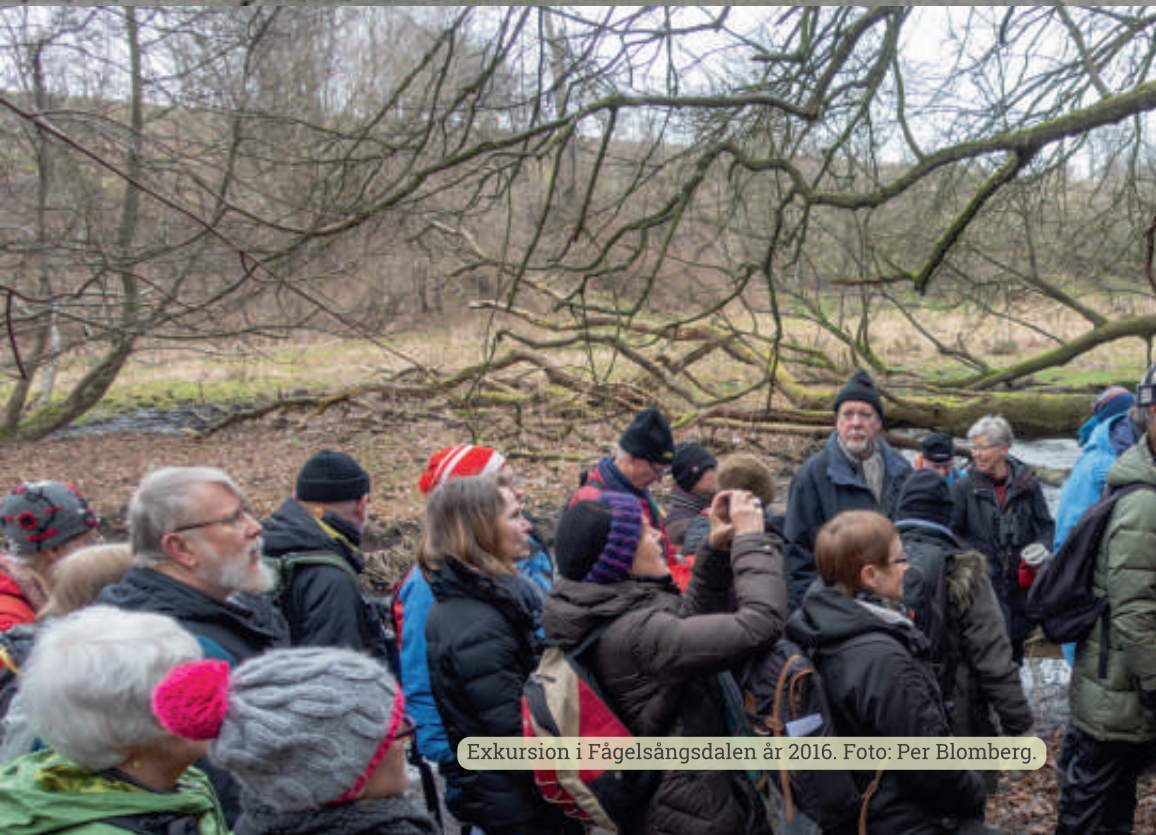
Exkursion i Fågelsångsdalen år 2016.