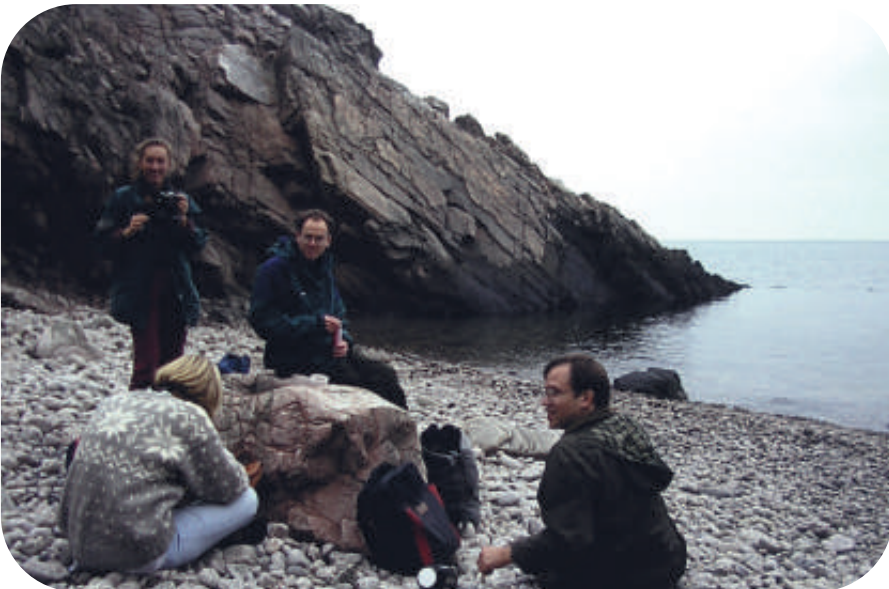
LuFS exkursion till Kullaberg år 1994.