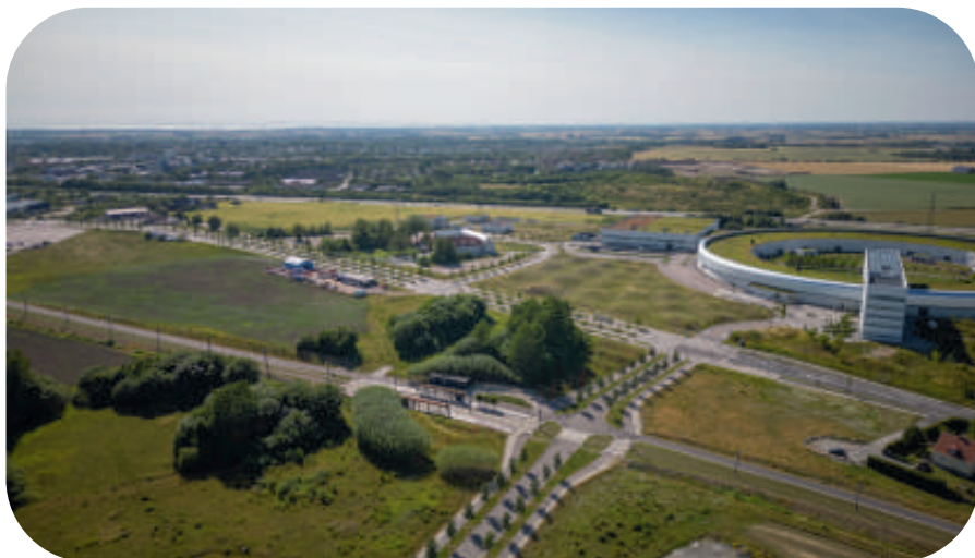
Brunnsnäs (LM2023/038793).

Föreningens senaste yttrande handlar om en dagvattendamm i Värpinge som kommunen vill anlägga. Kommunens ansökan har dock enligt LNF så stora brister att den inte bör beviljas utan stora kompletteringar. Det handlar bl.a. om att odlingar med rödlistade åkerogräs nära den tilltänkta dammen måste sparas, och att schaktmassorna från dammarna inte ska placeras där åkerogräsen odlas utan på platser som är svåra att bruka.