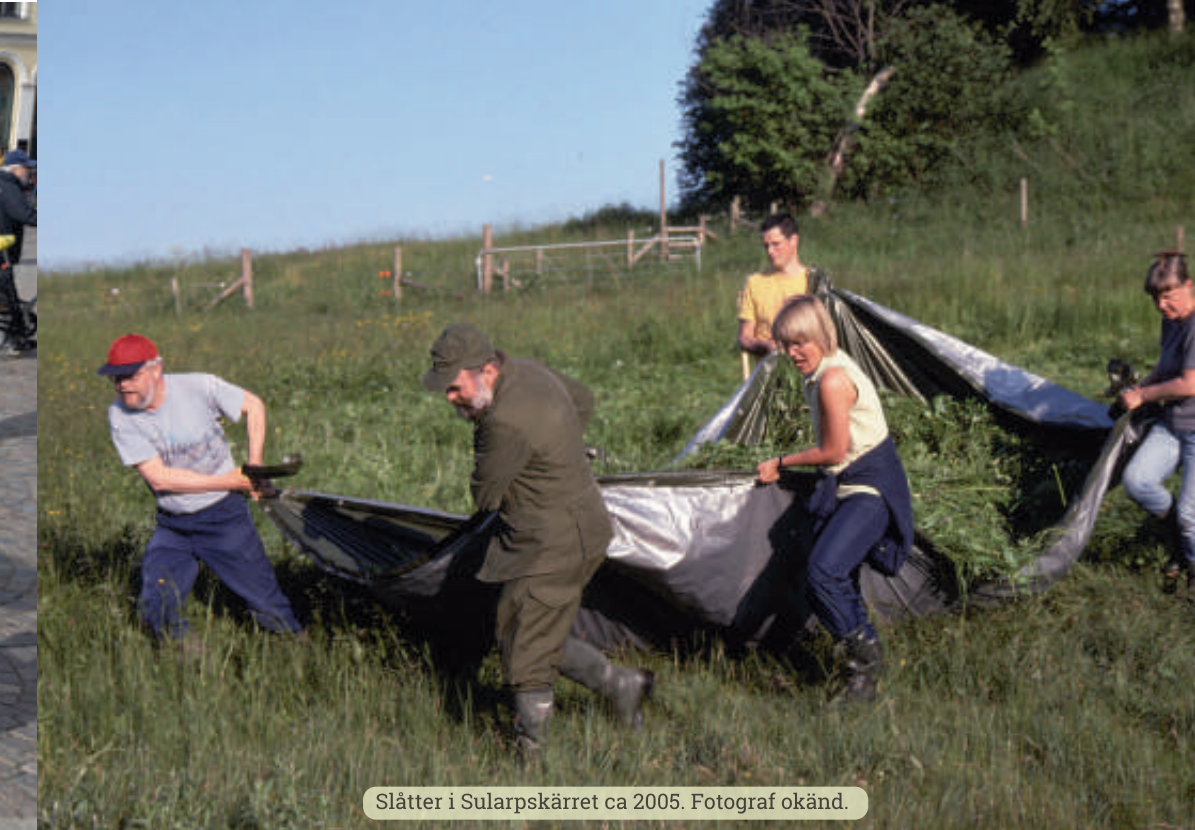
Slätter i Sularpskärret ca 2005.