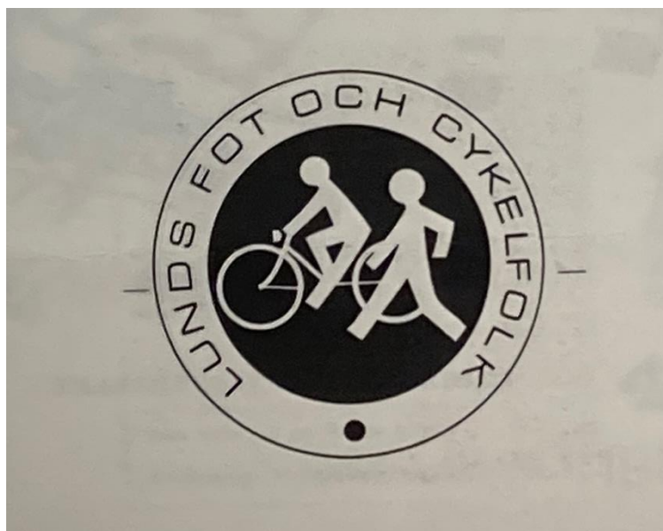
Lunds fot- och cykelfolks logo.

Under slutet av 1960-talet blev miljöfrågorna allt mer uppmärksammade i samhället och bilens miljöpåverkan var en central utmaning. 1968 hade debatten varit mycket intensiv i Lund om det planerade genombrottet där en fyrfilig väg skulle gå rakt igenom den medeltida staden. I sista stund fick motståndet mot genombrottet majoritet och projektet avvecklades. I stället blev det en långtgående reglering av biltrafiken i centrum med gågator och ökat utrymme för cyklister. Föreningen bildades strax efter stridigheterna och i början av omvandlingen av centrum som var tänkt att skapa en gång- och cykelvänlig stadskärna.