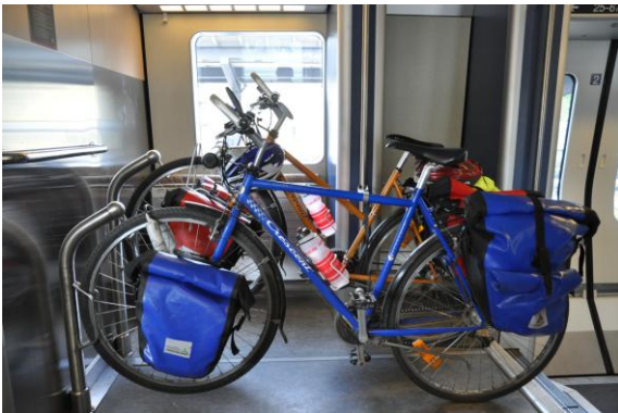
Fahrradständer im „Tåg i Bergslagen“.

Mit Tågab sind Räder zwischen Göteborg und Mora über Karlstad, Kristinehamn und Borlänge erlaubt. Es gibt ein paar Abfahrten pro Woche, Platz für zwei Räder (Wagen 13).