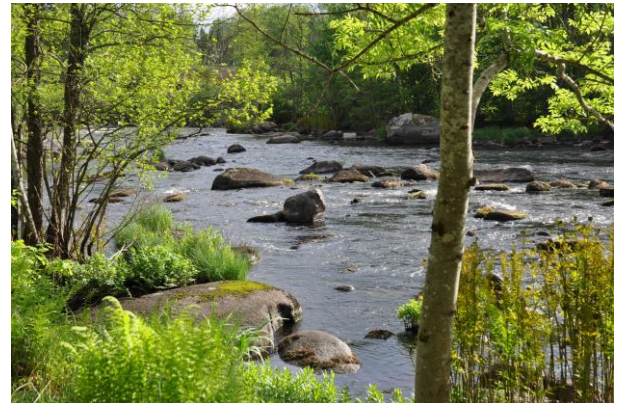
Bahndamm folgt dem Mörrumsån.

In Simrishamn beginnt der Sydostleden , der bis nach Växjö reicht. Er führt über Kristianstad und durch den Westen Blekinges, bis er Richtung Karlshamn abbiegt. Dort geht es weiter über Tingsryd nach Växjö. Große Teile der Strecke verlaufen auf alten Bahndämmen. „Sydostleden“ ist etwa 270 km lang, ohne Umwege 220 km.