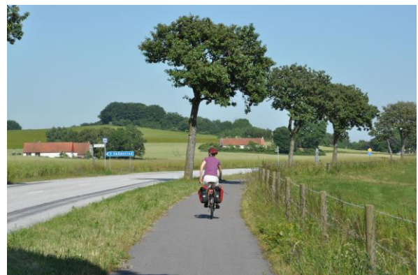
Zwischen Abbekås und Ystad.

Wir fahren etwa 10 km pro Stunde, einschließlich kurzer Pausen zum Fotografieren, Kartenlesen oder Betrachten. Beim gemütlichen Radeln schaffen wir etwa 30-40 km am Tag. Früher schafften wir bis zu 70 km am Tag, wenn wir richtig in die Pedalen traten. Heute schaffen wir „nur“ noch 40-50 km. Und für 50 km am Tag muss man nicht mal superfit sein!