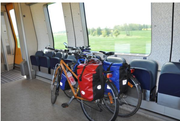
Fahrräder im Öresundståg bei wenig Verkehr.

Vielerorts dürfen Fahrräder nur außerhalb der Hauptverkehrszeiten (möglich zwischen 9-15 Uhr und nach 18 Uhr; ganztägig am Wochenende) mitgenommen werden. Diese Zeiträume sind generell empfehlenswert. In den Haupturlaubszeiten ist es am besten, am frühen Nachmittag oder am Abend zu reisen.