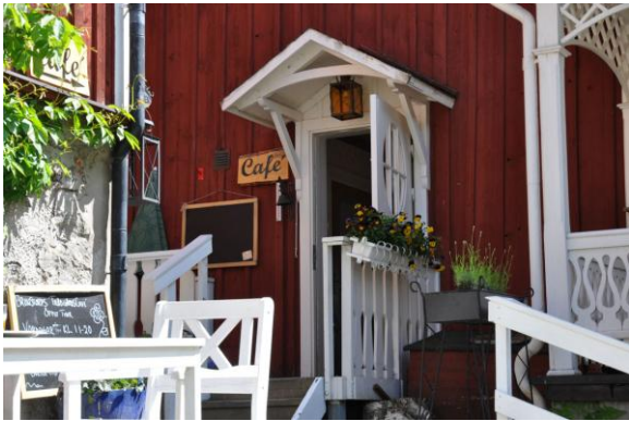
Ein schönes Café taucht auf, wenn man es am meisten braucht.

Wohlfühlen – das ist es, was meine Frau und ich wollen, wenn wir im Urlaub Rad fahren. Dazu am besten Temperaturen um die zwanzig Grad, Sonne und Rückenwind. Die Straßen sollten asphaltiert und frei sein. Unterwegs halten wir gern an Raststätten wie schönen Restaurants oder kleinen Cafés, je nach Tageszeit. Wir schlafen nicht mehr in Zelten, sondern suchen uns alles von Herbergen bis Hotel oder Hütte bis Schloss.