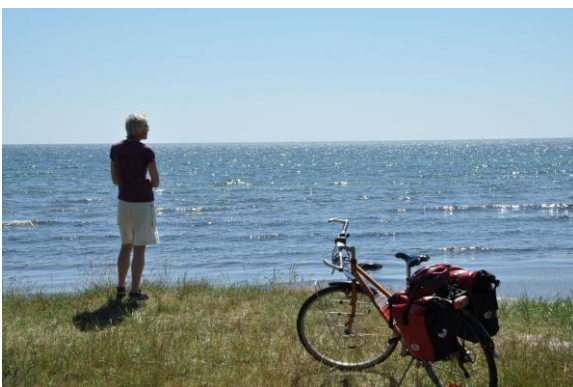
Die Küste bei Beddingstrand östlich von Trelleborg.

Der Südküstenweg ( Sydkustleden ) reicht von Helsingborg südwärts entlang des Öresund über Landskrona und Malmö nach Höllviken. Dann folgt er der Südküste über Trelleborg und Ystad nach