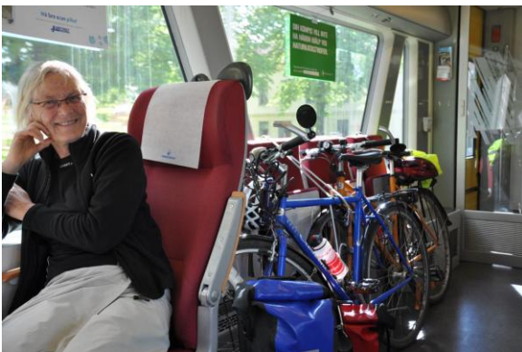
Fahrräder im Krösatåg.

Im Krösatåg sind Fahrräder auf allen verkehrsreichen Strecken kostenlos. Ausnahmen sind Strecken Richtung Norden von Kalmar nach Linköping, von Västervik nach Linköping sowie von Värnamo Richtung Borås.