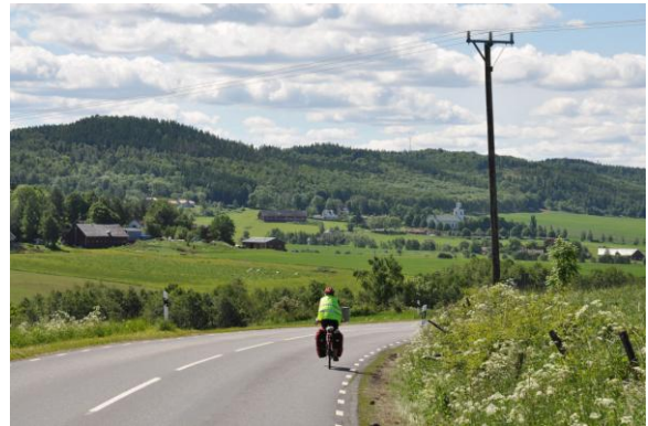
Kurze Rast am Vätternsee.

Freizeitfahrt handelt. Manchmal wollen wir weite Strecken fahren und andere Male wollen wir nur von Café zu Café fahren.