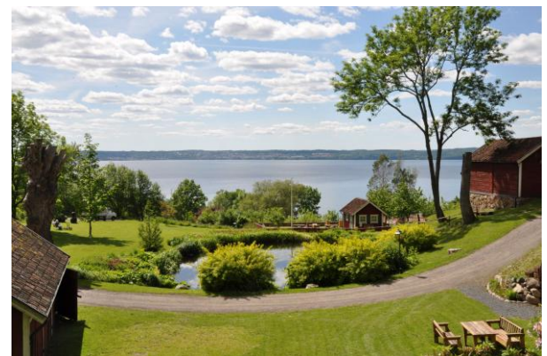
Café am Vätternsee nahe Husqvarna.

Will man eine längere Tour, ist diese hier sehr abwechslungsreich in ihren Landschaften. Über ein Viertel der Strecke sind reine Radwege, ein Drittel verkehrsarme Straßen. Viele Abschnitte fährt man auf der alten Landstraße