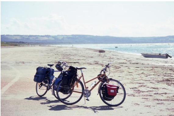
Skummeslövsstrand mit Hallandsåsen im Hintergrund.

Radeln Sie entlang der Westküste von Helsingborg nach Göteborg. Die Strecke ist als nationale Fahrradrouten, Kattegattleden , ausgeschildert. Die Strecke ist knapp 400 Kilometer lang, aber kürzbar an einigen Stellen auf insgesamt 300 Kilometer. Beispielsweise kann man über den Hallandsåsen über Grevie und direkt von Kungsbacka über Mölndal zum Ziel radeln.