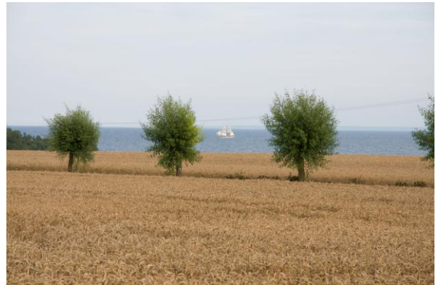
Küste östlich von Skillinge.

Das Ziel für eine entspannte Radtour ist Österlen. Man muss nicht einmal Fahrrad fahren, sondern kann einfach den Pågatåg nach Ystad oder Svarte nehmen und von dort die Küste entlang radeln. Die Straßen sind meist asphaltiert zwischen Ystad und Simrishamn, und verkehrsreicher zwischen Hammar und Skillinge.